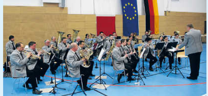
Feuerwehr- und Stadtkapelle