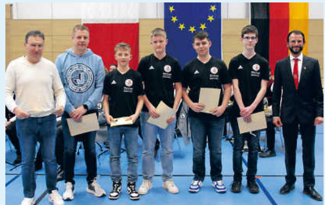
VfB Sennfeld Tischtennis