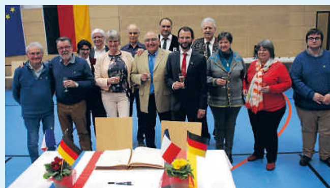
Gäste aus Berchères-sur-Vesgre