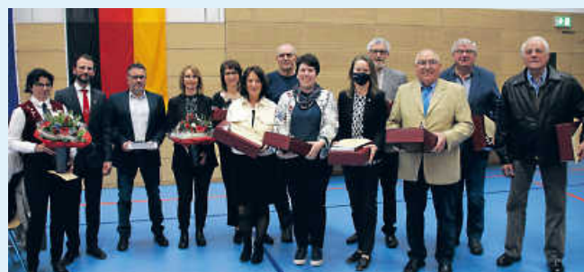
Vereins- und Gemeinderatsehrungen